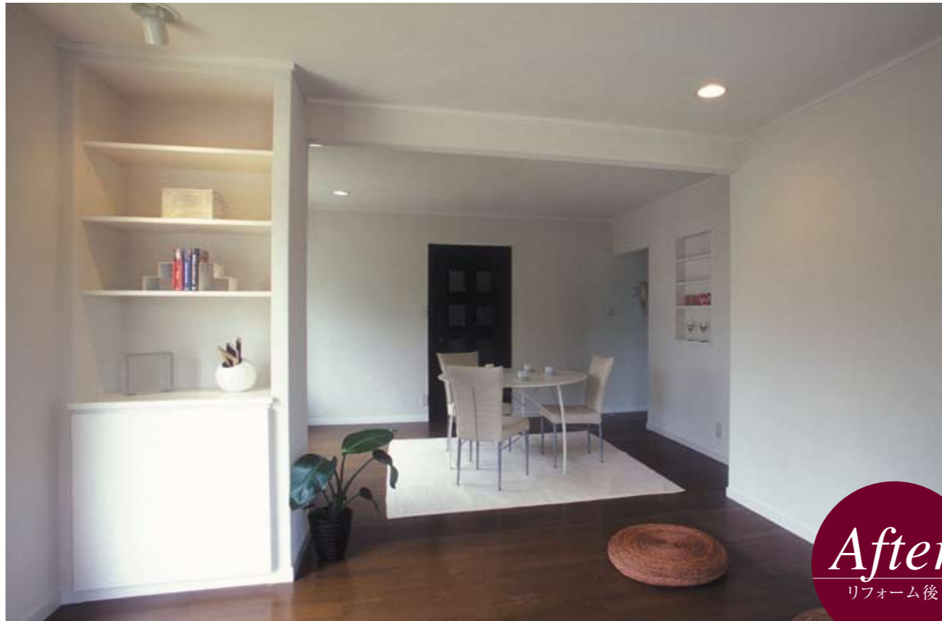
柔軟な対応で思い通りのリフォームに。あるべき所にあるべきものが収まっている、とても心地よい暮らし。