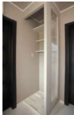
洗濯機コーナーも広めの収納に。