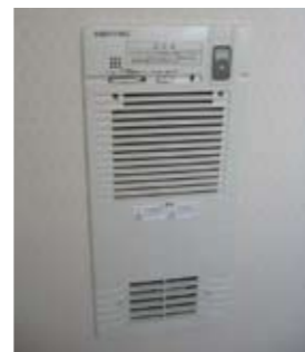
洗面所暖房機 TOTO製 商品定価¥72,450(税込) 壁埋め込み型暖房ヒートック製 商品定価 ¥51,975(税込)