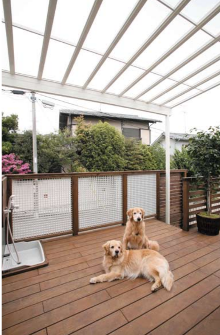
デッキの一部に施されたテラス屋根。雨の日でも快適な愛犬のお気に入りの場所に。

鉄骨造の駐車場のデッキスペースは、コンクリートへ特殊な工法で着色するグランドインブルーを使って、コスト・デザイン・耐久性・軽量化と納得のタイル調に仕上げました。既存1Fサンルームの採光を考慮し、床の一部をグレーチングにしたことで、光が透過する仕組みをもうけました。緑を楽しんだり、思いっきり洗濯物を干したり、ご友人を招いてのホームパーティーが楽しめる、大満足のデッキができました。