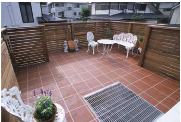
コスト・デザイン・耐久性・軽量化を実現した、グランドインブルーで仕上げたタイル調の屋上

鉄骨造の駐車場のデッキスペースは、コンクリートへ特殊な工法で着色するグランドインブルーを使って、コスト・デザイン・耐久性・軽量化と納得のタイル調に仕上げました。既存1Fサンルームの採光を考慮し、床の一部をグレーチングにしたことで、光が透過する仕組みをもうけました。緑を楽しんだり、思いっきり洗濯物を干したり、ご友人を招いてのホームパーティーが楽しめる、大満足のデッキができました。