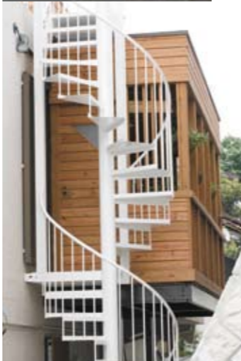
屋上を有効活用できる直通の螺旋階段。