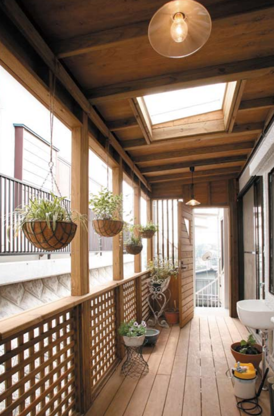
温かみのあるデッキ材をふんだんに使用した、格子と木目が美しいお洒落なバルコニー。