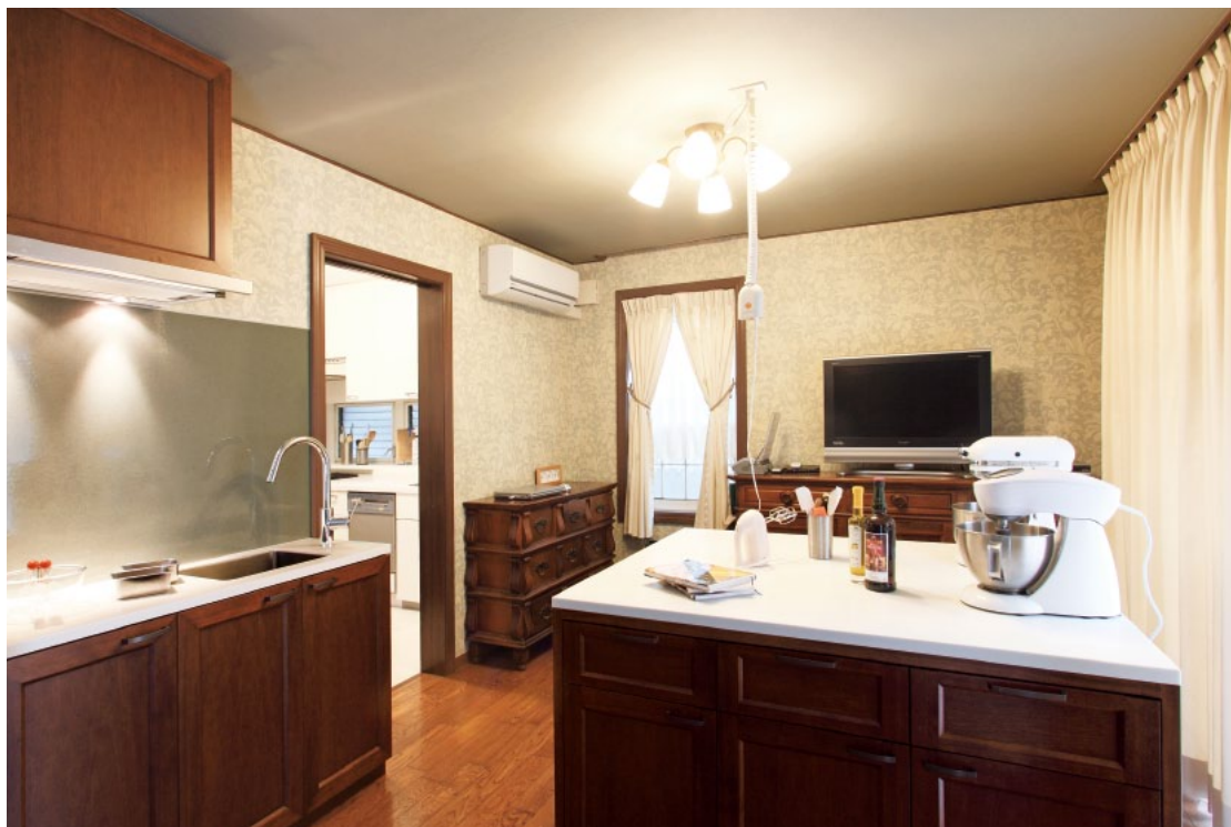
既存の空間にも自然と馴染む、特注家具のアイランドカウンター。