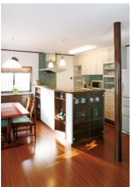
構造上外せなかった 丸柱を新しく入れ替え、 全体のアクセントに。