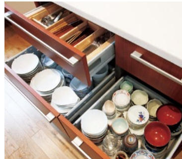
キッチン側から使う アイランドカウンターの収納。

2階のキッチンとリビングダイニングの間仕切り壁を撤去し、多目的に使用出来るアイランドカウンターを設置した、オープンなLDKにしました。既存の吹き抜けの梁、ダイニングテーブル、システムキッチンが上質の空間を生み出しています。