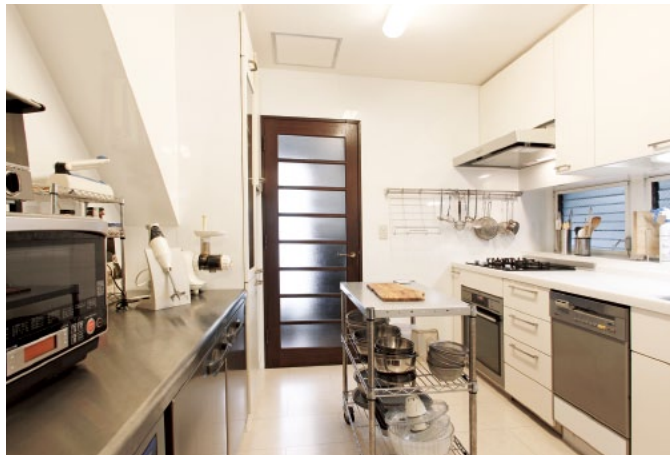
菓子製造業の特定基準をクリアした、使い勝手の良いキッチン。