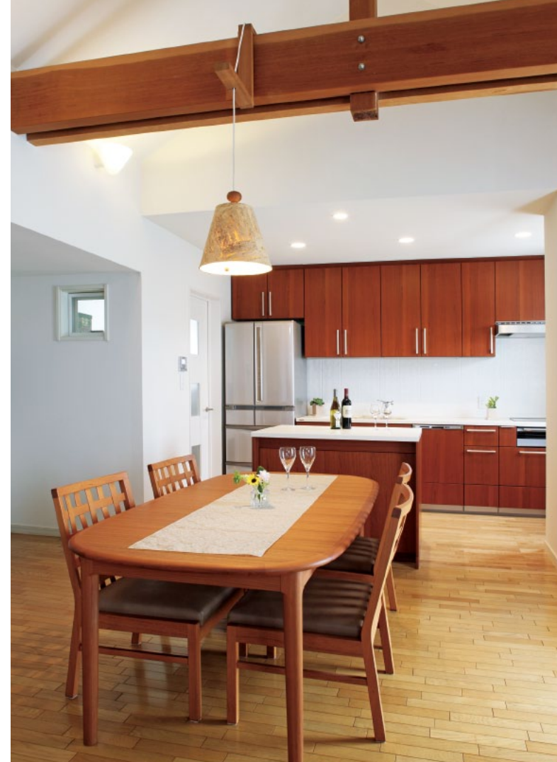
アイランドカウンターがある事で、オープンキッチンでも ダイニングとキッチンのゾーン分けが出来ています。