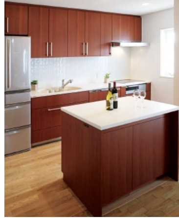
多目的に利用出来る アイランドカウンター。