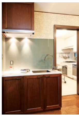
レンジフードカバーも 扉材で造作した、 特注家具のミニキッチン。

耐震工事とバリアフリー改装工事の際、キッチンをリフォームしました。家具を固定する事で耐震性がアップし、更に食器や調理器具がどこにあるか一目でわかりやすい、収納しやすいキッチンになりました。また、食器洗浄器やIHヒーター等の設備で使いやすさにも配慮しています。