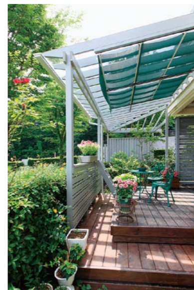
ステップ状に拡張したデッキと強化ガラス・日よけシェードを付けたパーゴラ。