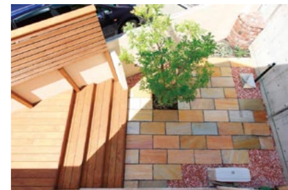
以前のジメジメを払拭した清潔感あるテラス。

横浜市 M様邸デッキ&テラス工事 《担当者》ハイブリッドホーム横浜青葉店/瀬下 雪絵 ◎工事費用/約280万円