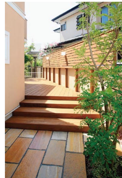
ウッドデッキと石張りテラスに高低差をつけ、変化のある空間に。