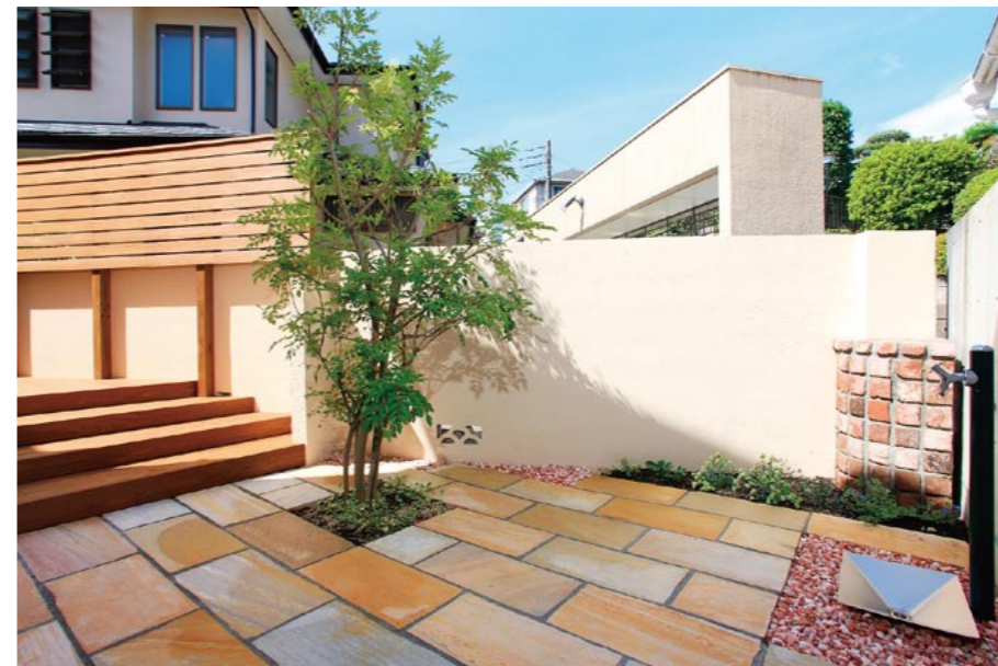
湿気で汚れていた塀は、耐候性、防藻・防カビ性、低汚染性に優れた塗り壁材「ジョリパット」で一新。