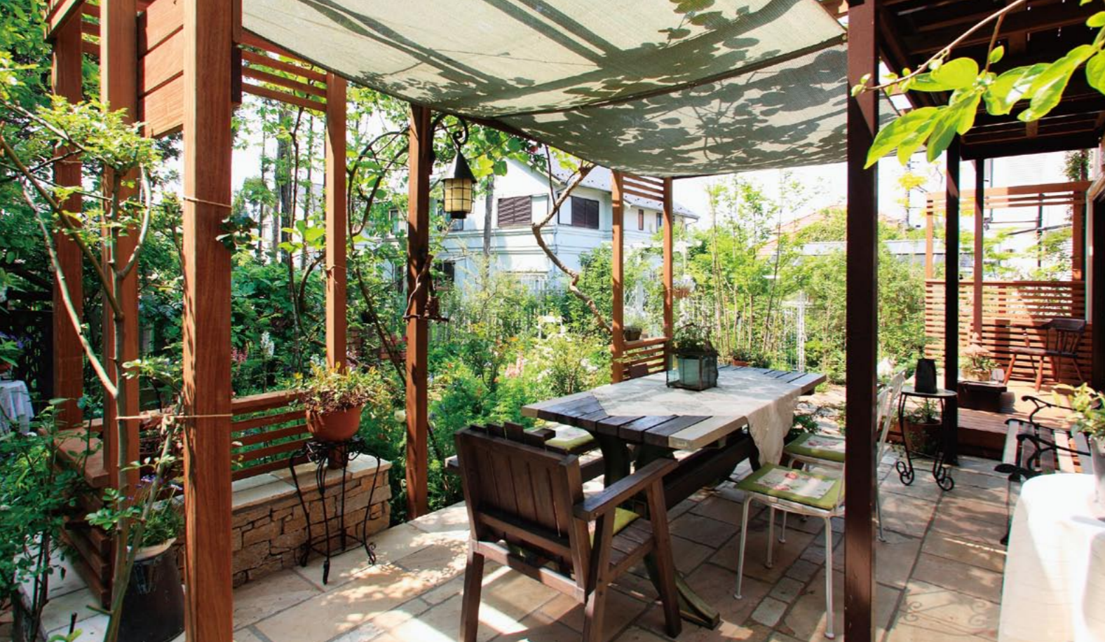
砂岩デザイン張りのテラスと日よけ付きのパーゴラ。心地よい空間で、ティータイムを楽しめます。