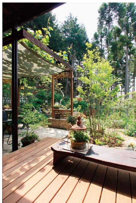
和室から続くウッドデッキ。ここからは、杉林を借景したガーデンが一望できます。