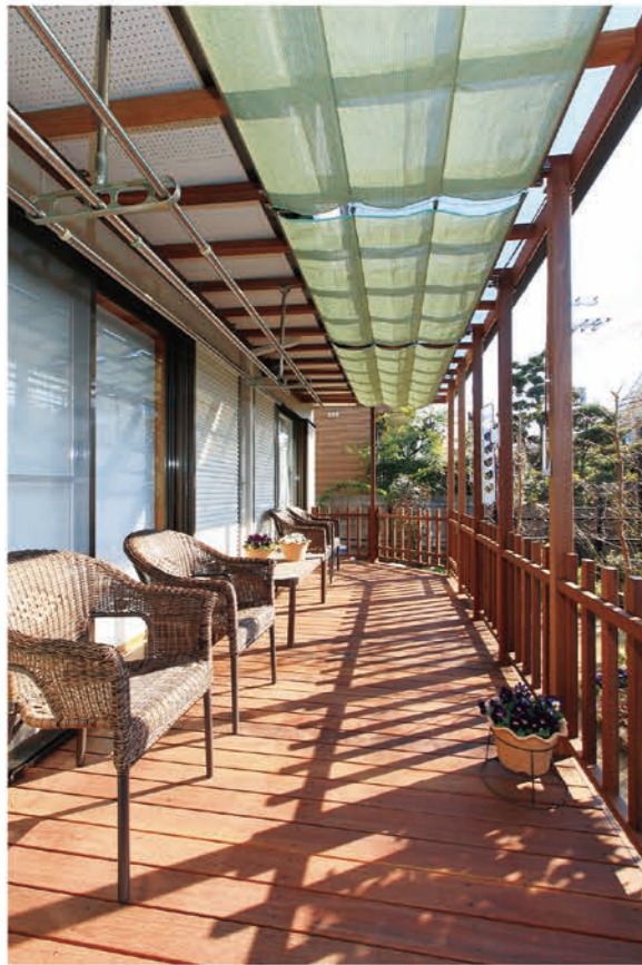
UVカット機能のあるポリカーボネートと開閉可能なシェードを付けたパーゴラ。