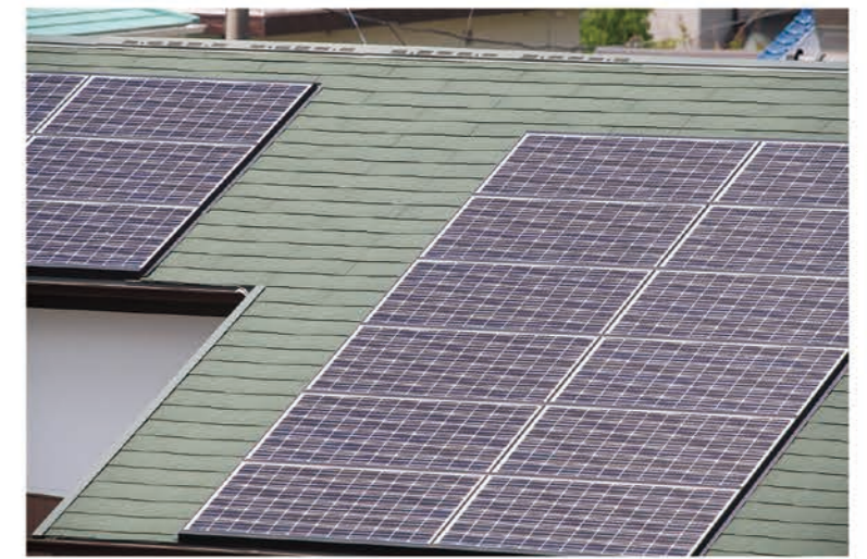
屋根材の機能を兼ね備えた太陽光パネル、「野地びたF」。(パナソニック)

築30年経過したS様邸。屋根の葺き替え時期となり、以前よりご興味を持たれていた太陽光発電の設置も含めた屋根のリフォームをご提案しました。そこで、屋根材の機能も兼ね備えた太陽光パネルを採用。太陽電池の下は屋根材が不要となるため、既存の屋根の上に設置するタイプに比べると、屋根は軽く、建物への負担を和らげます。加えて建物の重心が低くなり、地震による揺れを小さくする減震効果も期待できます。しかも、世界最高水準のモジュール変換効率で毎日たっぷり発電しています。また、同時にエコキュートを設置。太陽光発電で電気を作って、エコキュートで電気を無駄なく活かすWの省エネを実現しました。自然の力をエネルギーにして暮らせる最高のエコです。