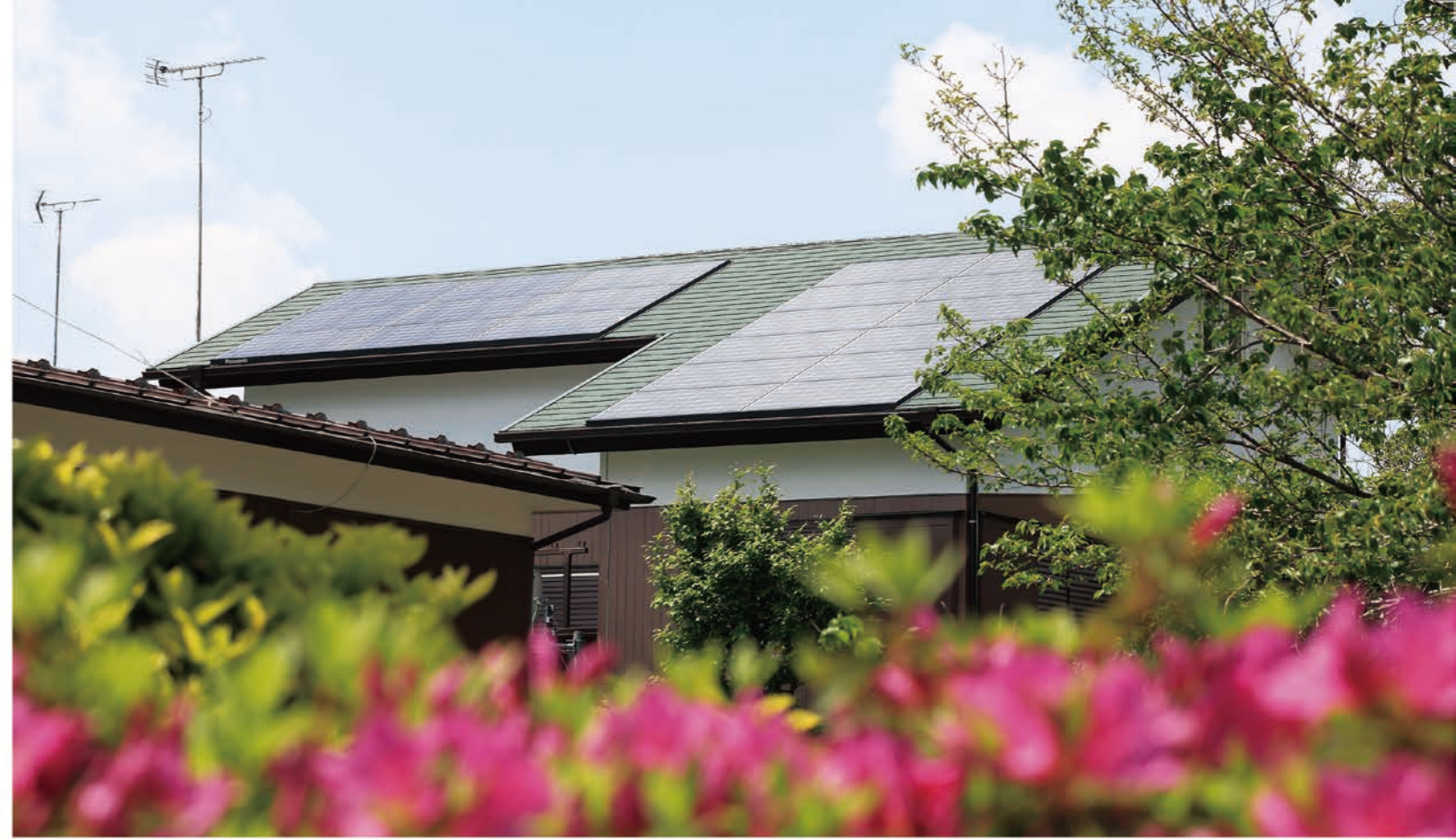
限られた屋根スペースを無駄なく活用し、より多くの光を取り込み、しっかり発電します。