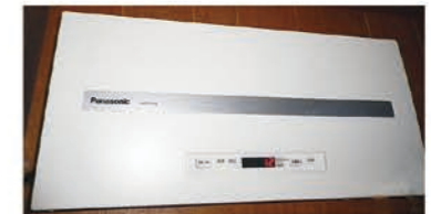
パワーコンディション