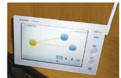
エネルギーモニター

リビング、ダイニング、寝室など、好きな場所で発電量や売電額がひと目でチェックすることができます。住まいのエネルギーを「見える化」して、節電をサポート。