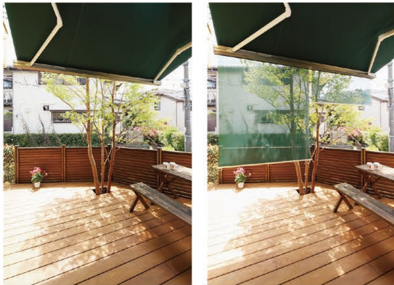
前枠にメッシュのスクリーンを内蔵したオーニング。日差しの強さや目的にあわせていろいろな使い方ができます。

さんと太陽の陽が降り注ぐ吹抜けのリビング。気持ちの良い空間ですがこれからの季節は熱がこもりエアコンの効きも悪くなってしまいます。今回、お庭のウッドデッキ工事に併せて、日除けのオーニングを設置することをご提案しました。同時に、リビング掃出し窓の対面にある廊下のF I X窓を全開口できる窓に交換しました。風が抜けるようになったことで、こもりがちだった空気が流れるようになり、快適なリビングになりました。