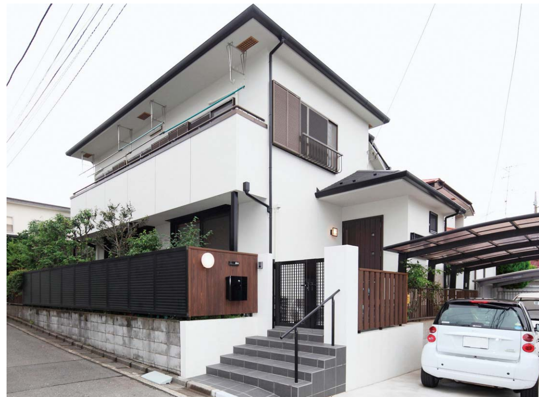
ゆとりのあるアプローチ。新しい門扉には、防腐加工が施された天然木を使用し、表情豊かになりました。

日当たりが大変良い S 様邸。しかし、以前のバルコニーは小さく道路からまる見えだった為、洗濯物が干せずあまり活用できていませんでした。今回、お子様の成長に伴い1階を増築することとなり、その上部をルーフバルコニーにすることをご提案。機能的でゆとりのある空間が出来ました。同時に、建物全体を耐候性・耐久性及び低汚染性に優れた塗料にてアイボリー色に塗装し、外観イメージを一新しました。