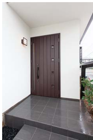
柿渋柄の木目調アルミ玄関ドアと黒のタイル・玉砂利でモダンに。