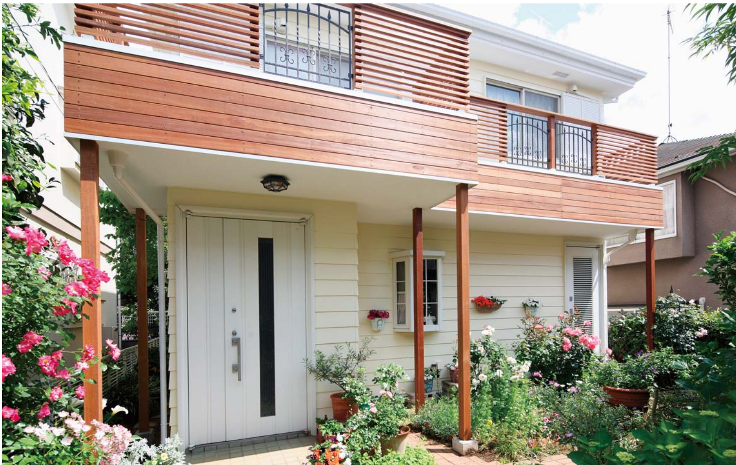
デッキ材の羽目板張りや横格子&アルミ鋳物の手摺で生まれ変わったバルコニー。建物全体の印象がガラリと変わりました。