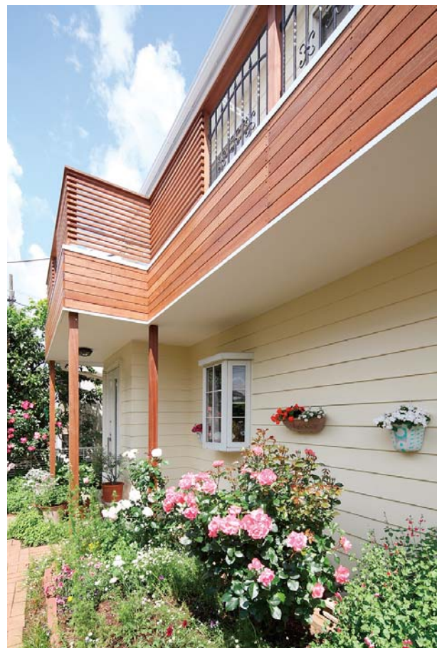
塗装で一新したサイディングの外壁には、奥様お手製のプランターが映えます。バラのガーデンとの相性も抜群です。

防水劣化と土台の腐蝕により、新規に作り直さなければいけなくなったバルコニー。以前は、外壁と同じサイディングで造られていましたが、イメージを一新したいとのご要望で、セラカンバツ材を使用したデザインをご提案しました。当然経年変化により定期的なお手入れが必要となりますが、それにもまして自然素材本来の温もりや質感、手作り感を大事にした外観のアクセントとなり、お庭も含めたトータルコーディネートが出来ました。