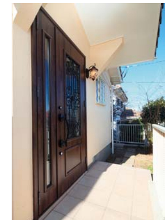
アイアン格子がポイントの華やかなデザインの玄関ドアに交換。