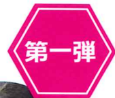
うさぎ のウーちゃん