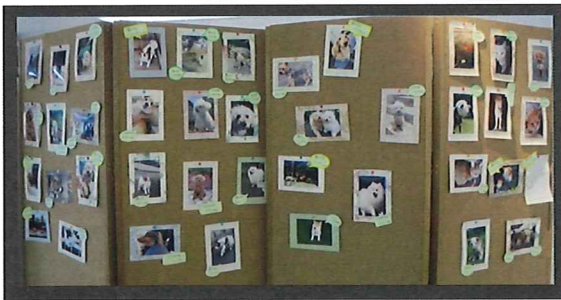
◇昨年横浜青葉店にて開催した様子◇