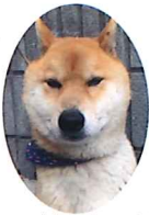
シバ犬のケンタ君