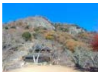
巨大自然石の城門