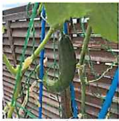
▲ちよと曲がり気味君

新型コロナウイルス感染症の状況が落ち着いて少しずつ元の暮らしに戻りはじめた今日、皆様いかがお過ごしでしょうか？しかし、まだまだ感染症対策に気を付ける必要があります。どうぞ、夏の暑さに負けず、健康的な生活を送られますようお祈り申し上げます。