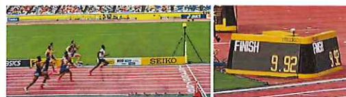
▲5月「セイコーゴールデンランプリ陸上」世界の速さを体感！

ジャパンラグビー・リーグワンプレーオフ準決勝を観戦。この日クボタスピアーズのブースTシャツが無料で配布され、私も「オレンジアミー」の仲間入り。8月にはワールドカップ直前の日本代表試合（フィジー戦）を観戦予定です！